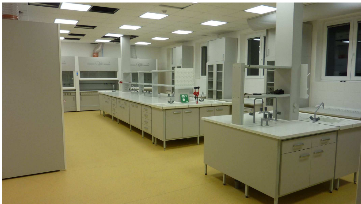
příklad provedení vkládacích skříněk laboratorních stolů s kovovou konstrukcí - lze nabídnout i jiné rovnocenné řešení

- v případě požadavku na skříňky v laboratorních stolech s kovovou konstrukcí bude konstrukce doplněna předním spodním spojovacím vlysem a skříňky budou provedeny jako vkládací; pohledové krajní boční pole rámu sestavy bude vyplněno vloženou deskou