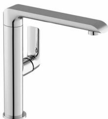
tvarový příklad baterie - lze nabídnout i jiné rovnocenné řešení

Pákové stojánkové baterie , povrchová úprava chrom, ramínko otočné o 360°, kartuš keramická, výška cca 260 mm, bez výpusti, jednoduchý tvar v kombinaci zaoblených a rovných ploch, záruka min. 5 let