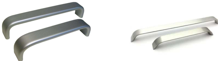
tvarové příklady nábytkových úchytek - lze nabídnout i jiné rovnocenné řešení