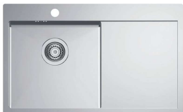
tvarový příklad jednoduchého s odkapem

Vestavné jednoduché s odkapem - čtvercový či obdélníkový jednoduchý (rozměr cca 400x400 mm), doplněný hladkou odkapovou plochou vpravo, celková š. cca 800 mm, nerez, tl. materiálu min. 0,8 mm, hloubka dřezu cca 170-190 mm, s otvorem pro baterii, s přepadem, horní montáž do roviny (s minimálním výškovým rozdílem mezi okrajem dřezu a pracovní deskou)