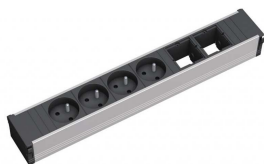
tvarový příklad zásuvkové jednotky

- vestavné zásuvkové jednotky do desky stolu, s počtem modulů dle jednotlivých položek, s možností variabilní konfigurace, hliníkové profily vložené do vestavných uzavíratelných rámečků (stříbrně šedých) s jednoduchým výklopným otevíráním stisknutím víka, malá vestavná hloubka – cca 55 mm