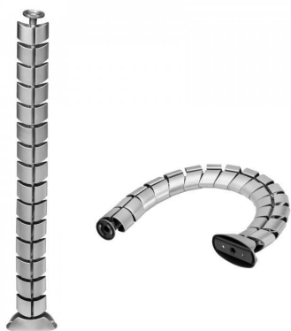
tvarové příklady kabelových svodů

– pro vedení kabelů od desky stolu k podlahové krabici, plast s povrchovou úpravou ve stříbrné nebo černé barvě (dle budoucího barevného řešení nábytku)