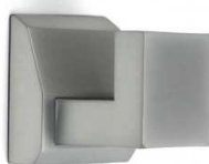
tvarový příklad šatního háčku - lze nabídnout i jiné rovnocenné řešení