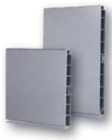
tvarový příklad lišty nábytkového soklu - lze nabídnout i jiné rovnocenné řešení