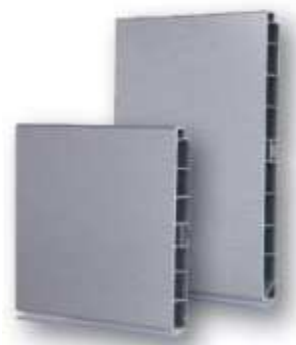
tvarový příklad lišty nábytkového soklu

- sokly – plně omyvatelné, konstrukčně samostatná část, v. 100 mm, povrchová úprava nacvakávací lišty broušený hliník, včetně rohů a koncovek, nutná koordinace provedení soklů s fabiony podlahových krytin, odvětrání v místě vestavných chladniček výseky v soklu (nikoliv vloženou mřížkou)