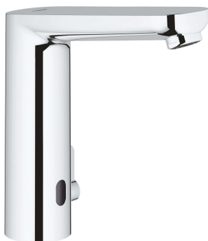
tvarový příklad senzorové baterie - lze nabídnout i jiné rovnocenné řešení

Baterie senzorová - stojánková baterie senzorová, se směšovacím zařízením a nastavitelným omezovačem teploty, s připojením do sítě (230 V, popř. s trafem), povrchová úprava chrom, kartuš keramická, vysoká výpusť - výška baterie min. 170 mm, výška výpusti min. 150 mm, jednoduchý tvar v kombinaci zaoblených a rovných ploch, záruka min. 5 let