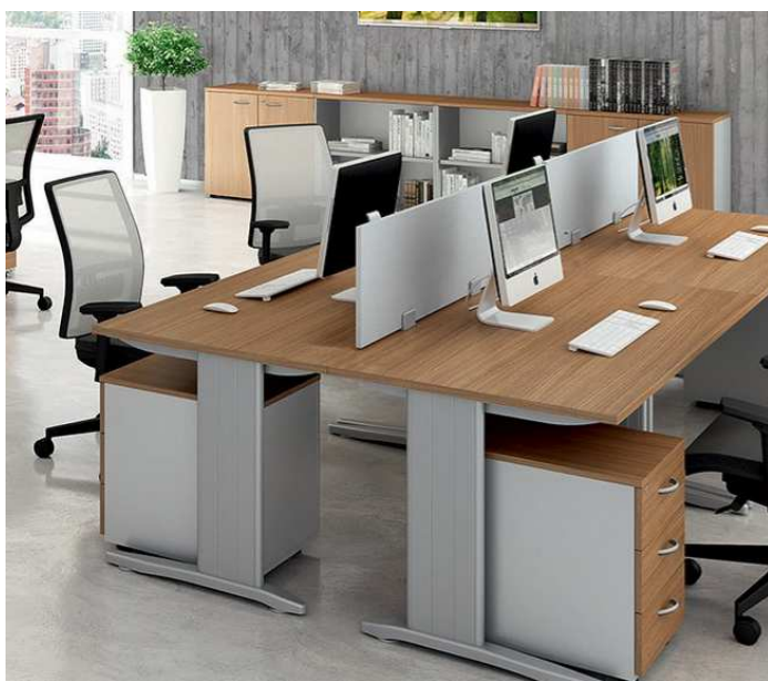
tvarový příklad podnoží kancelářských stolů - lze nabídnout i jiné rovnocenné řešení

Podnože kancelářských stolů – kovové kancelářské stolové konstrukce se skrytým vertikálním i horizontálním vedením kabeláže, tvořené spodními a horními ližinami, excentrickými postranními nohami (bočnicemi) š. cca 200 mm (výběr z více typů bočnic) a spojovacím mostem, fixní výška, povrchová úprava v odstínu dle vzorníku RAL (výběr zástupců univerzity a architekta zakázky). Požadována je možnost vytváření sestav stolů včetně rohových sestav.