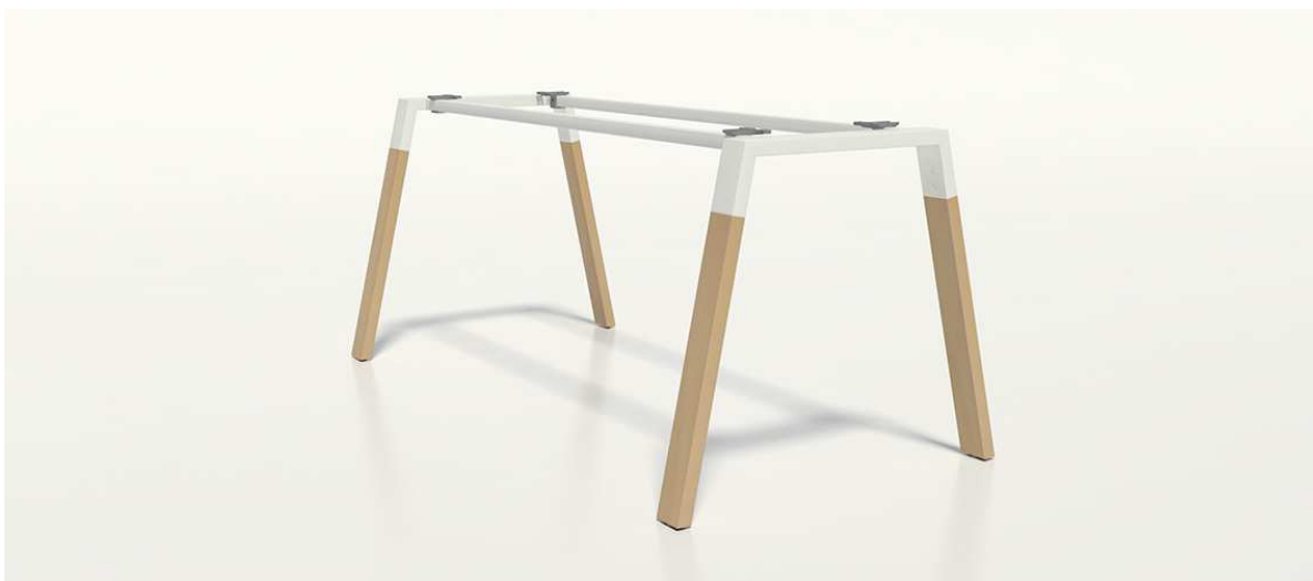
tvarový příklad podnože jídelních stolů - lze nabídnout i jiné rovnocenné řešení

Podnože jídelních stolů – stolová konstrukce v kombinaci dřevěných nohou a kovového mostu dle tvarového příkladu, možnost volby druhu dřeva a odstínu kovových částí