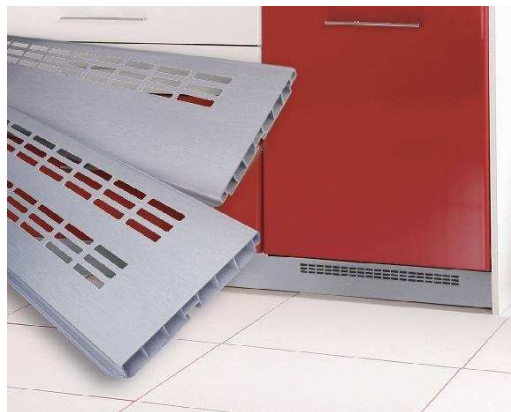
příklad řešení výseků v soklu

- lze nabídnout i jiné rovnocenné řešení