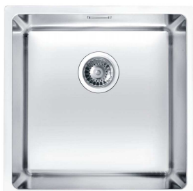
tvarový příklad jednodřezu - lze nabídnout i jiné rovnocenné řešení

Vestavné jednodřezy - čtvercové či obdélníkové, nerez, tl. materiálu min. 0,8 mm, rozměr cca 400x400 mm, hloubka cca 170 mm, bez otvoru pro baterii, s přepadem, horní montáž do roviny (s minimálním výškovým rozdílem mezi okrajem dřezu a pracovní deskou)