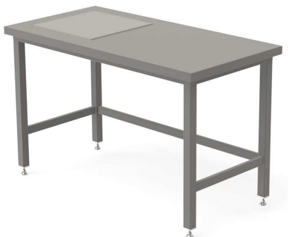
tvarový příklad váhového stolu - lze nabídnout i jiné rovnocenné řešení

- váhové stoly budou mít v pracovní desce nezávisle pružně uloženou žulovou desku cca 400x400 mm pro eliminaci vibrací vzniklých v okolí, kovová konstrukce stolů bude z ocelových profilů cca 30/30 mm nebo cca 40/40 mm (dle jednotlivých položek), obdobná jako u laboratorních stolů, přesná poloha žulové desky dle upřesnění zástupců univerzity