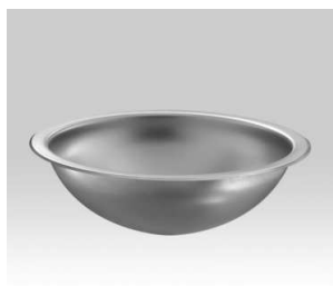
tvarový příklad umyvadla - lze nabídnout i jiné rovnocenné řešení

Vestavná umyvadla - kruhová, nerez, tl. materiálu min. 0,8 mm, průměr cca 400-450 mm, hloubka cca 140-180 mm, bez otvoru pro baterii, horní montáž